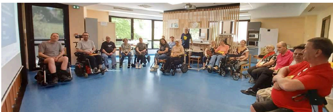
Au Centre Médical G.Revel