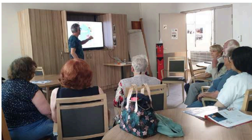
A la Résidence Danton