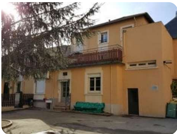
Le Foyer des Peupliers à Villeurbanne

Le foyer des Peupliers accueille 30 enfants. L'implication des équipes est remarquable. Malgré les difficultés, ils font le maximum pour accompagner ces enfants victimes de carences éducatives graves ou de violences.