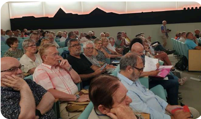
Les lyonnais à l'assemblée générale d'AGIRabcd le 19 juin à Paris