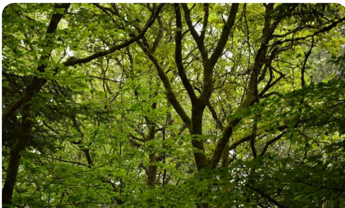
La forêt du Mont Saint-Rigaud : zone en libre évolution

Parmi ces activités, des actions de sauvegarde et de valorisation de milieux naturels. Ainsi FNE est devenue propriétaire de forêts dans le massif du Saint-Rigaud dans le Nord du département du Rhône dans le but de leur préservation.