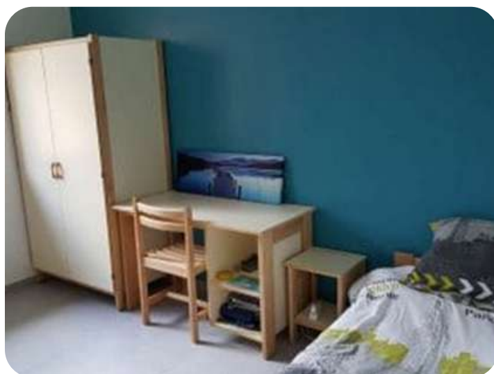
Une chambre d'enfant