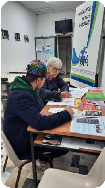
ORA: binôme mentor-mentoré