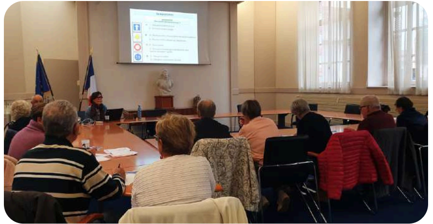
AGIRoute à Millery